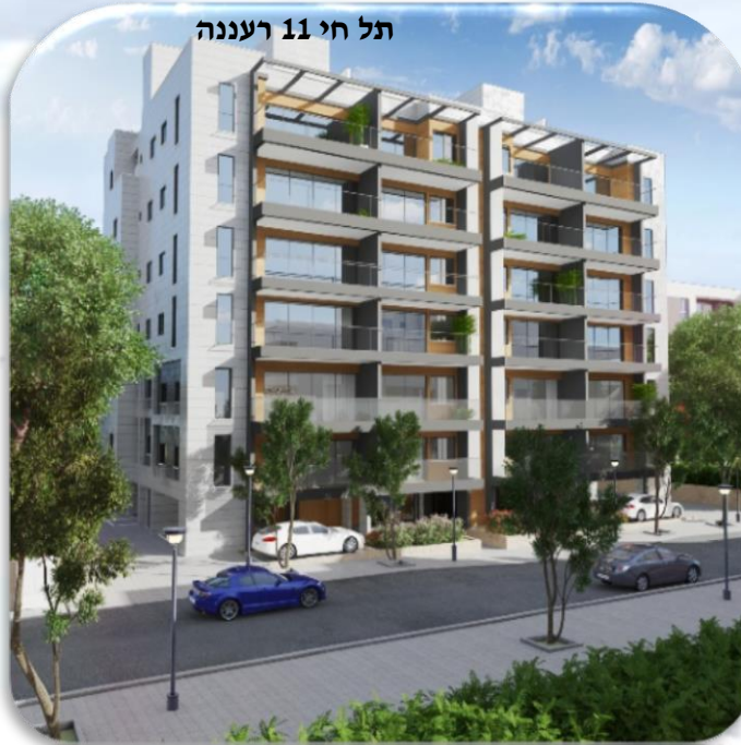
תל חי 11 רעננה