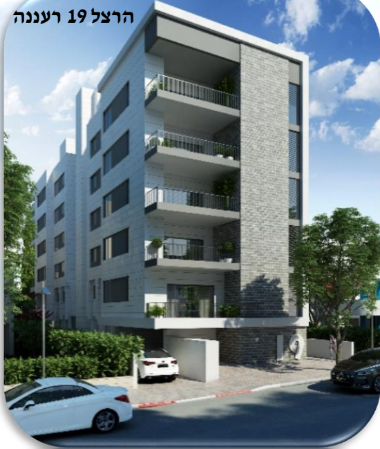
הרצל 19 רעננה