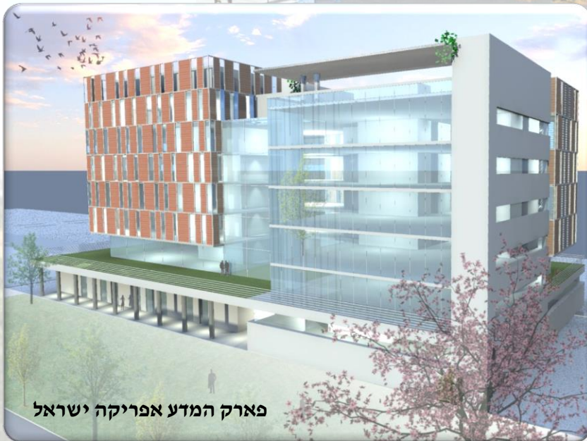
פארק המדע אפריקה ישראל