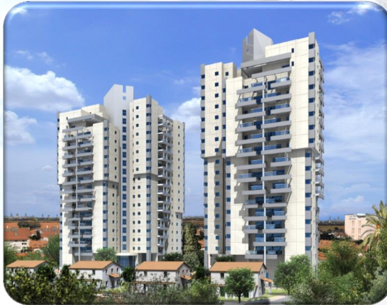
עין זיתים – תל אביב