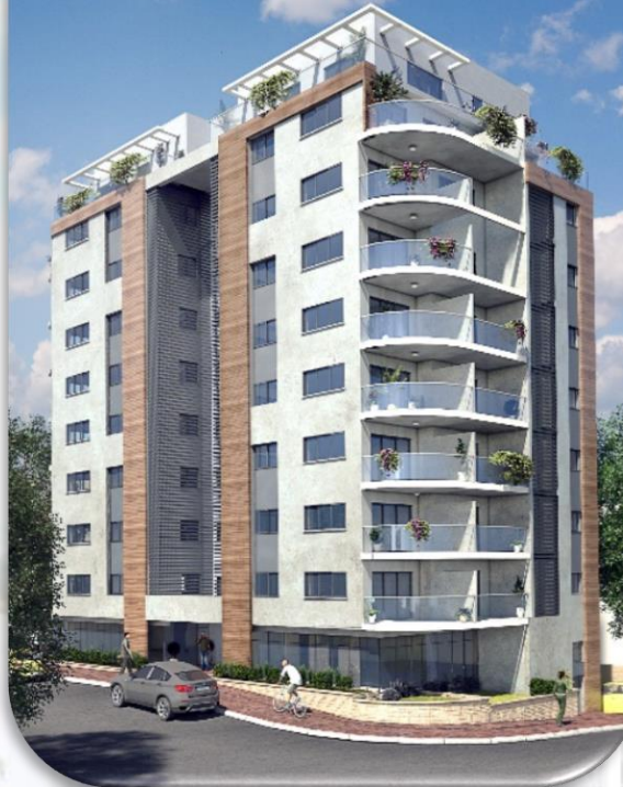
הרא"ה 243 רמת גן