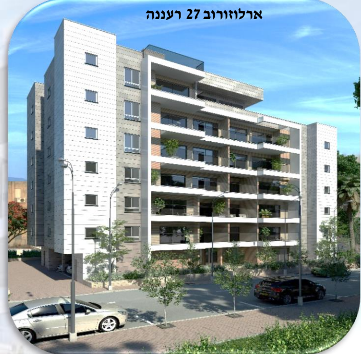
ארלוזורוב 27 רעננה