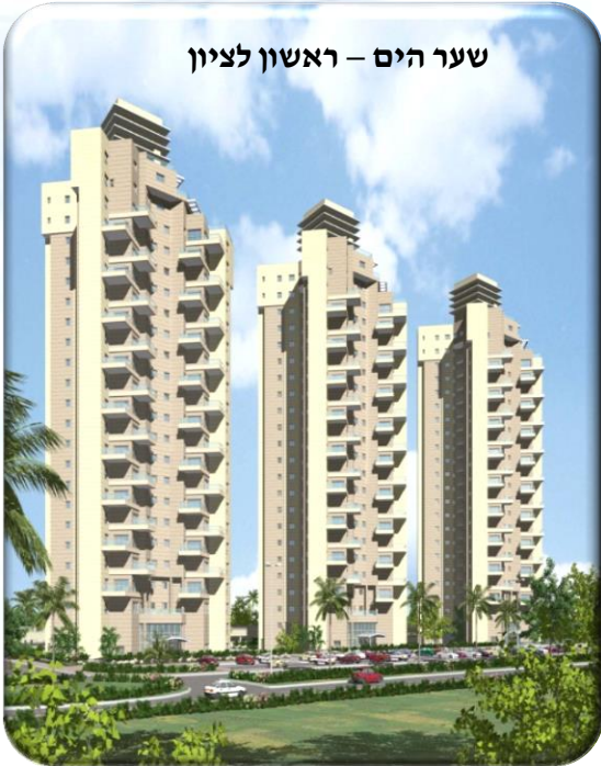
שער הים – ראשון לציון