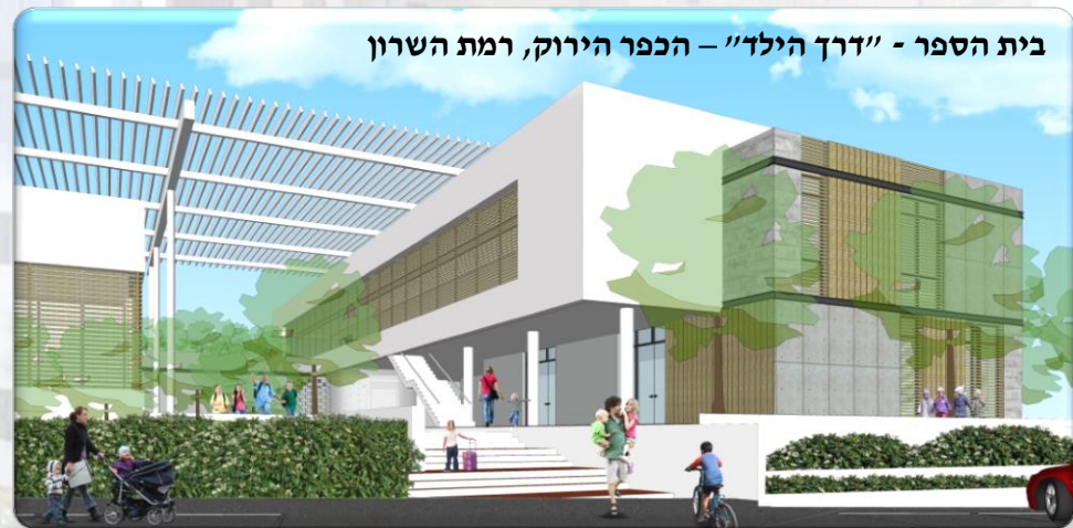
בית הספר - "דרך הילד" - הכפר הירוק, רמת השרון