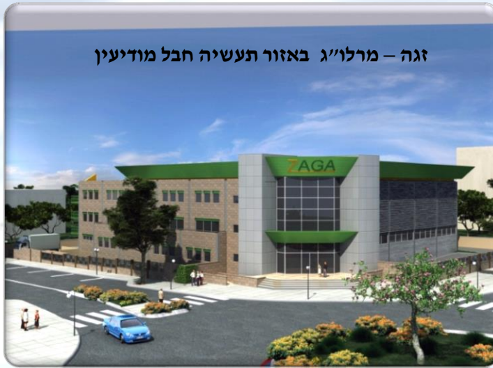
זגה - מרלו"ג באזור תעשייה חבל מודיעין